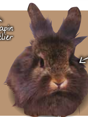
Lapin tête de lion