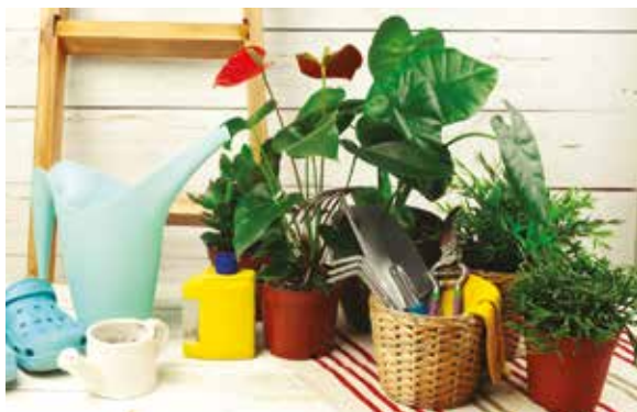
* Le collet est la partie de la plante qui est comprise entre la tige et les racines.