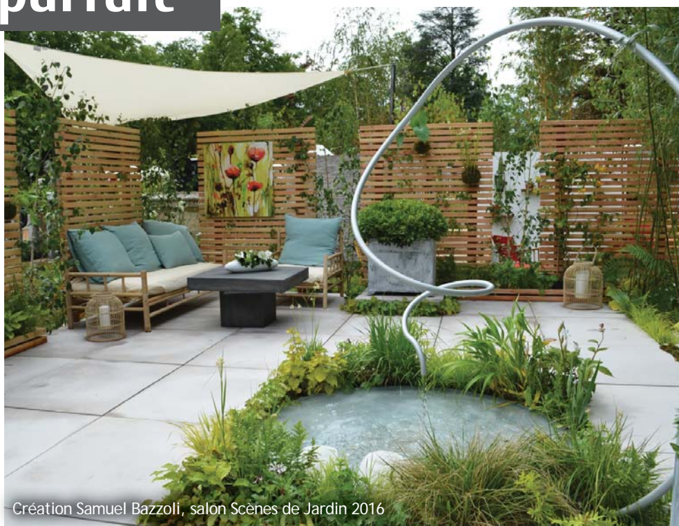
Création Samuel Bazzoli, salon Scènes de Jardin 2016

► Un bassin vient aussi rafraîchir l'espace terrasse, pour le plaisir de voir et entendre l'eau couler. Les enfants comme les