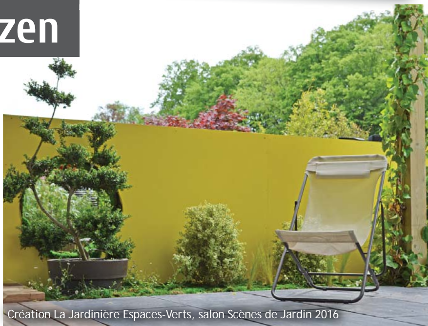
Création La Jardinière Espaces-Verts, salon Scènes de Jardin 2016

(Ilex crenata), celui-ci est placé dans un pot dont le fond est intégré dans le sol mais qui dépasse aux deux tiers de la surface.