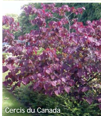
Cercis du Canada