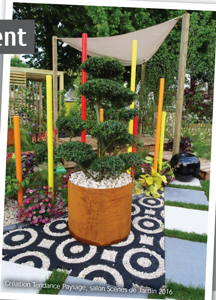
Création Tendance Paysage, salon Scènes de Jardin 2016